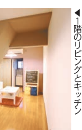
1階のリビングとキッチン

2割高い4万8000円の賃料で成約した。しかも募集から1カ月たらずに成約した。同物件の特徴は古さを魅力に変えたこと。間取り変更など大掛かりなベニシヨンの結果、「レトロな雰囲気が入った」と内見後すぐに2人の子供をもつ30代女性が入居を決めた。