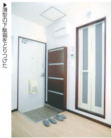
▲薄型の下駄箱をつけた

入居を決めた。同じ間取りの新築物件。建物は築20年。バス・トイレ別の和室のワンルームをフロアリングに張り替え、内装は壁紙や建具は白を基調とし、黒をベースとした家具を設置した目もスタイリッシュで使い勝手がよくなったからという。竣工して、モニターの施工を見るときに間違った。家具はすべてIKEA。さらに、プレハブ施工